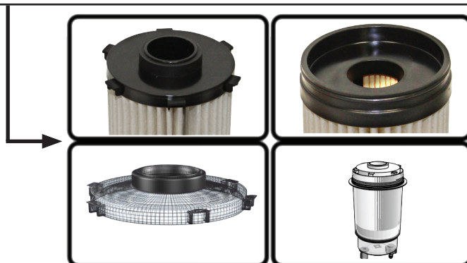
Filtre de première génération Filtre de deuxième génération

Le changement du capuchon supérieur permet au filtre d'être muni d'un plus gros joint d'étanchéité, alors que le capuchon inférieur a maintenant un joint torique. Ce nouveau joint torique améliore l'étanchéité des nouvelles cartouches au bas du boîtier.