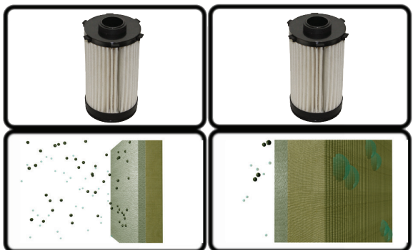
Matériau coalescent multicouche

Le nouveau modèle utilise un matériau coalescent multicouche qui élimine à la fois l'eau et les contaminants solides. La couche extérieure retient les contaminants solides, tandis que la couche intérieure force le contenu en eau à former des gouttelettes plus grosses. Ce procédé est appelé la coalescence. Comme l'eau est plus dense que le carburant, les gouttes plus grandes tombent au fond du boîtier du filtre, d'où on peut les vidanger. Le matériau coalescent du nouveau modèle possède moins de plis, mais chaque pli est plus grand. En fait, la surface réelle de filtration a augmenté dans ce filtre de deuxième génération.