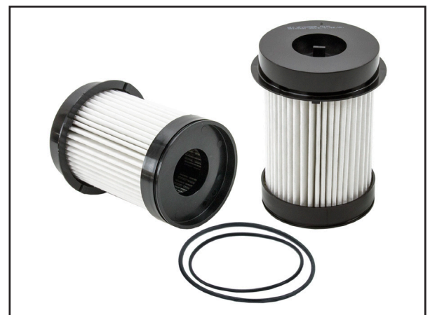
Remplace OES 68157291AA 2013-2016 Ram Trucks 6.7L Diesel

L'addition des nanofibres améliore considérablement l'efficacité et la capacité du filtre ; il convient donc parfaitement au besoin de filtration très fine. Ce nouveau filtre séparateur eau-carburant maintenant disponible est prêt à servir les exigences de la nouvelle technologie des moteurs en procurant des performances supérieures en protection et en filtration.