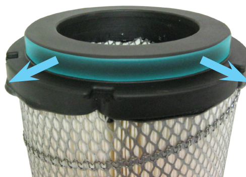
Type modifié 46907

Le joint précédent était semblable au joint d'origine (OES) qui scellait au-dessus de l'extérieur du tube de débit d'air.