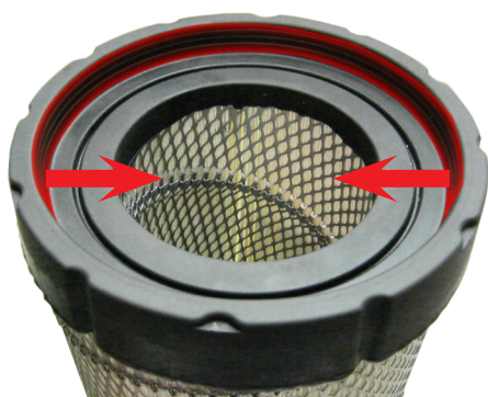
Ancien type 46907

Le filtre 46907 a fait l'objet d'une modification récente, avec un changement important du joint d'étanchéité.