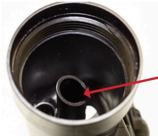
Patte d'alignement du tube central